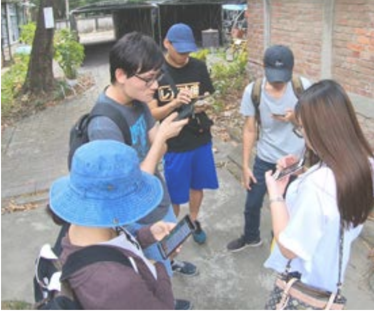
▲出去玩囉！實際跑流測試遊戲。