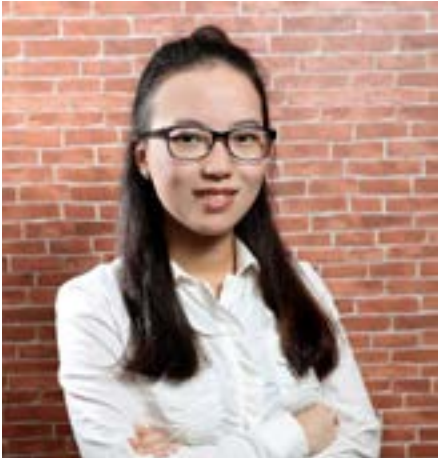
◀ 奕馨學姊於大四成為 Rookie Fund 學生投資人