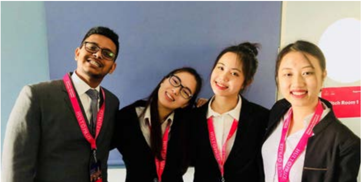
▲奕馨學姊（左二）和隊友們參與霍特獎