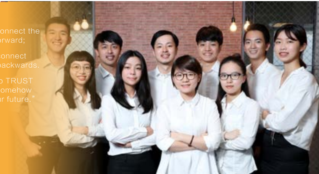
▲奕馨學姊（前排右二）與 Rookie Fund 學生投資人夥伴